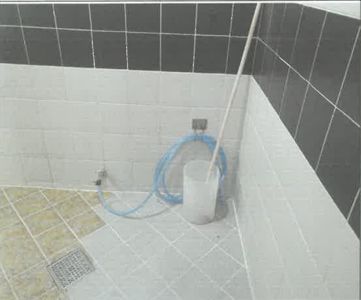
수영장 남자 샤워실 청소용 호수 누수 처리