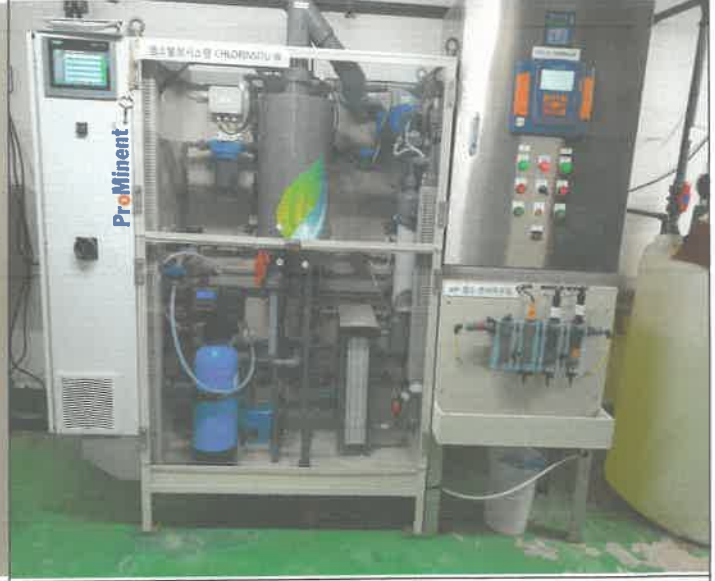
수영장 순환배관 후렌지 교체 및 약품 주입구 후렌지 및 밸브 교체