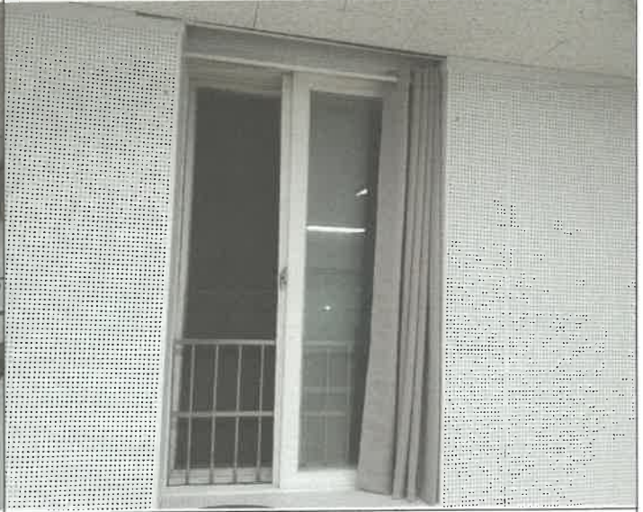
2층 유스 4실 창문 방충망 탈거 되어 제 설치