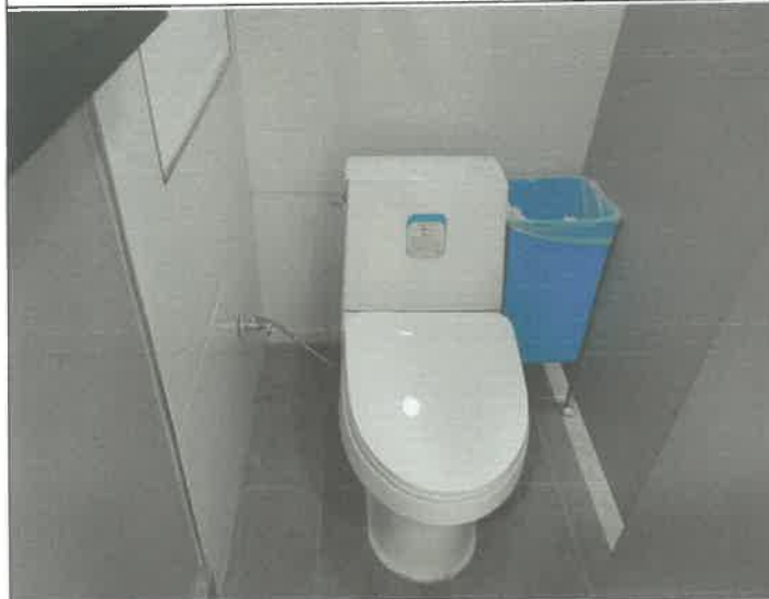
1층 여자 화장실 변기 막힘 통수