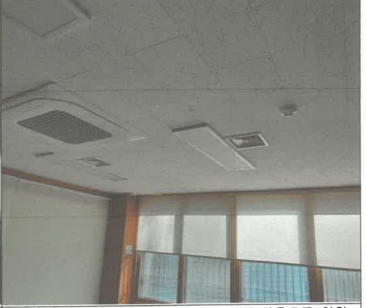
화재 감지기(차동식) 겨울철 냉난방기 사용으로 인한 오작동 위치 변경 - 3층(스포츠 스페이스, 드럼실A.B, 헨델실)