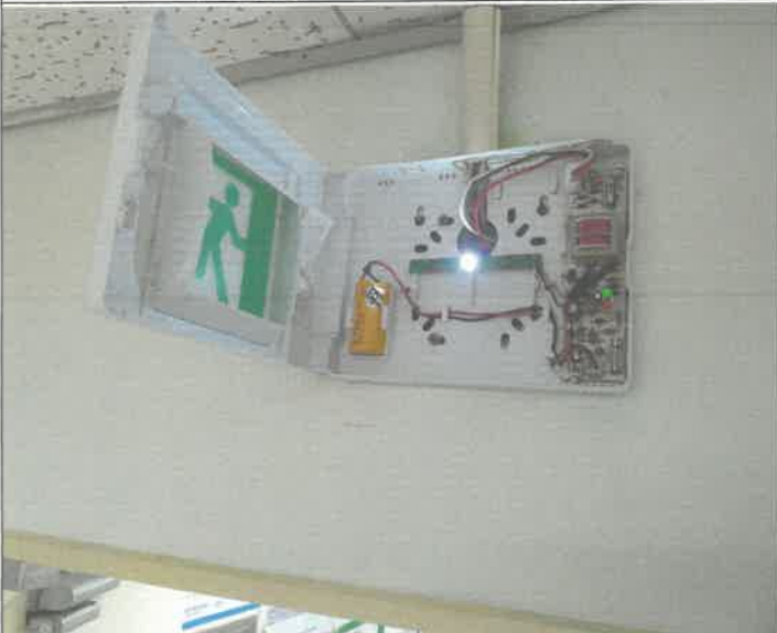
2층 복도(상담 센터) 피난 유도등 점등 불량 LED 기판 교체