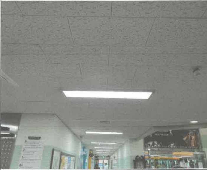
1층 중앙 복도 천장 매립등 커넥터 불량 교체 1개소