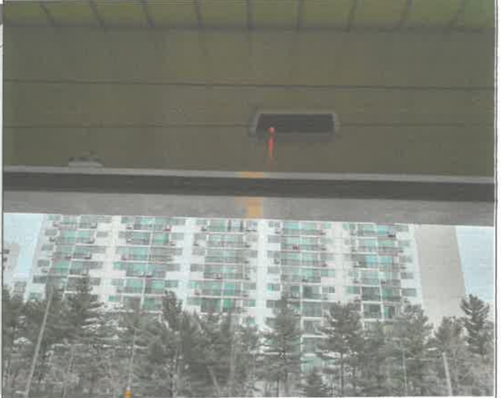
수영장 출입구 자동문 센서 부착