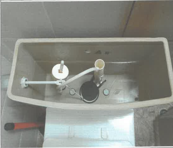
수영장 남자 샤워실 화장실 변기 고무바킹 고정