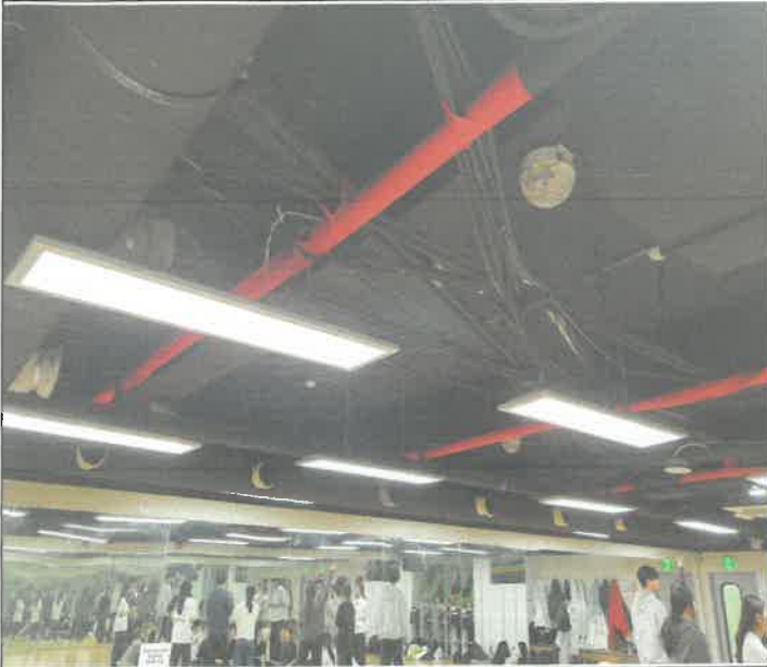
지하 1층 소체육관 전등 재결선