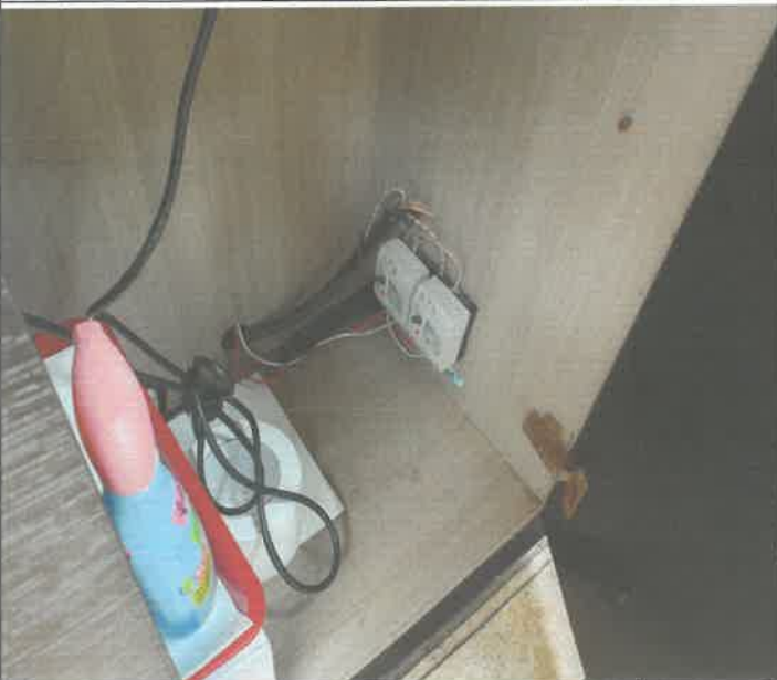
수영장 로비 헤어드라이기 전원 차단기 부분 것 차단 점검 복구