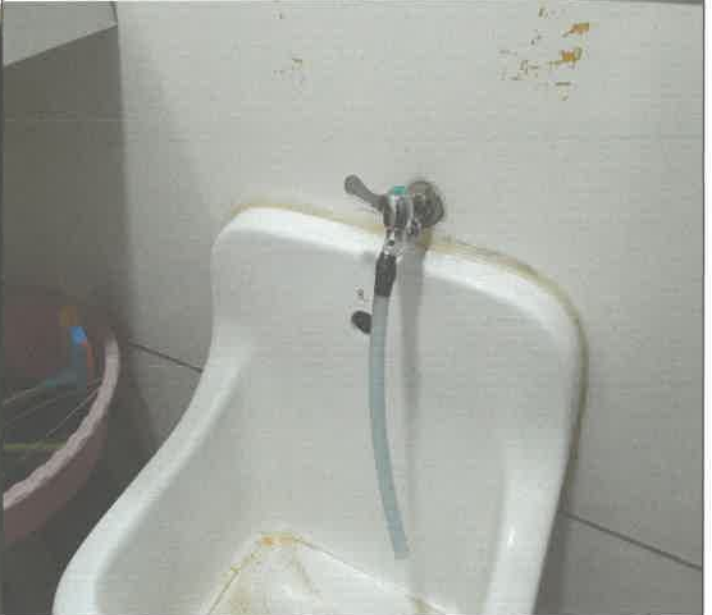
3층 남자 화장실 탕비실 수도 꼭지 교체