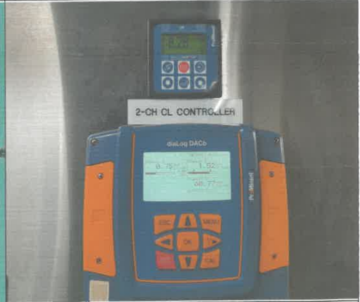
염소 발생기 작동 상태 점검 및 물 필터 교체 및 유리.총.결합 염소 보정