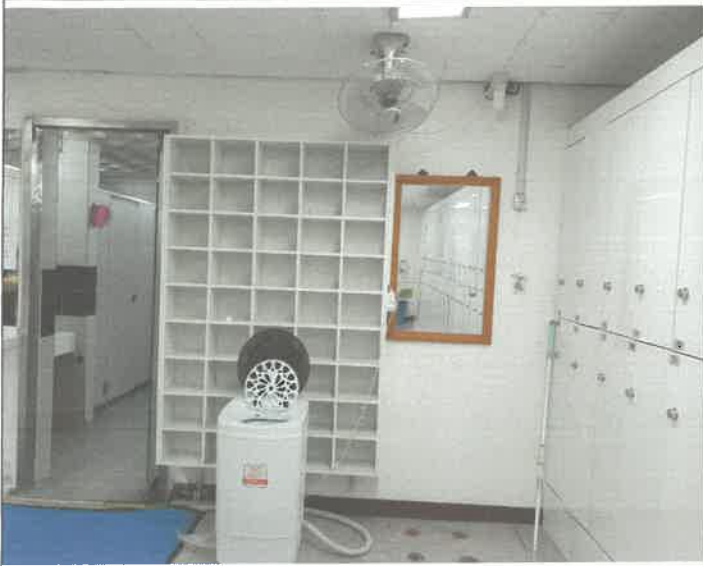
수영장 여자 탈의실 탈수기 전열 누전 전등에 결선