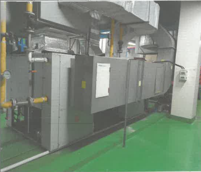
수영장 공조기 웬 모터 및 전자 개폐기 교체