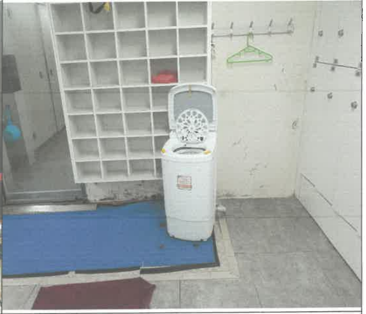
수영장 남. 여. 락카실 청소기 고장 수리