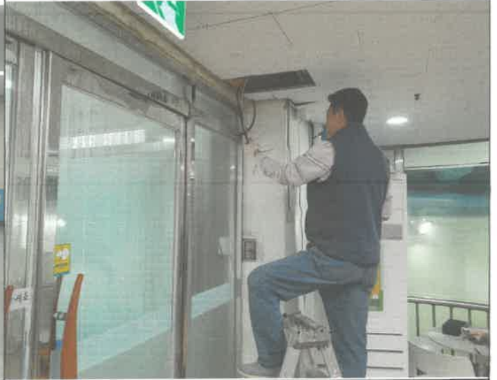
수영장 입구 자동문 전원 선로 포설 공사