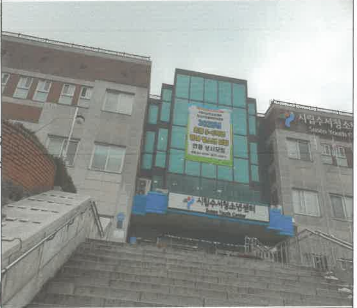
방가후 대형 현수막 외 2기 외부 설치 작업