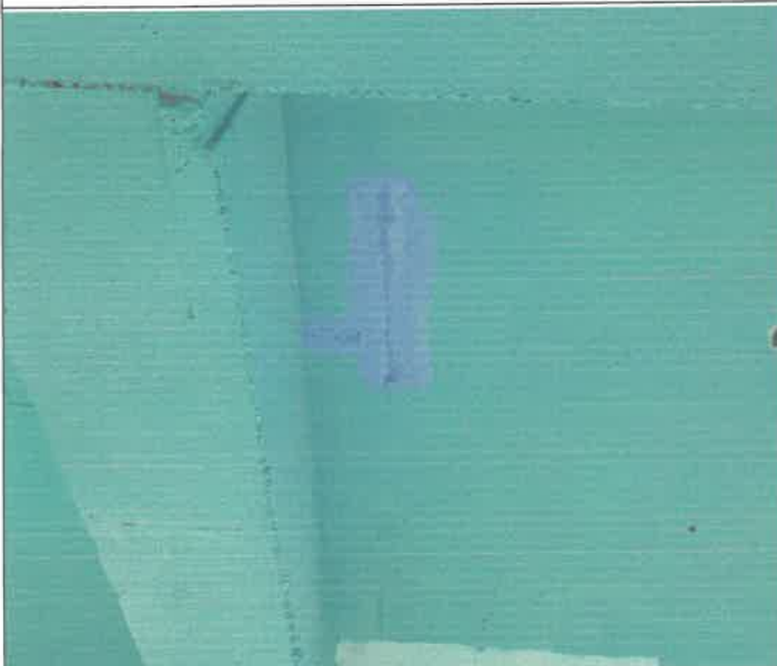
수영장 유아플 쪽 천장 철근 노출 방청 페인트 칠