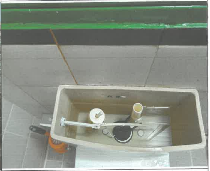
수영장 여자 샤워장 화장실 변기 고무바킹 교체