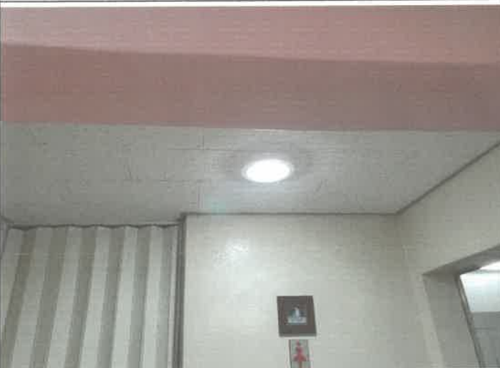
2층 여자 화장실 입구 자동 센서 등 교체