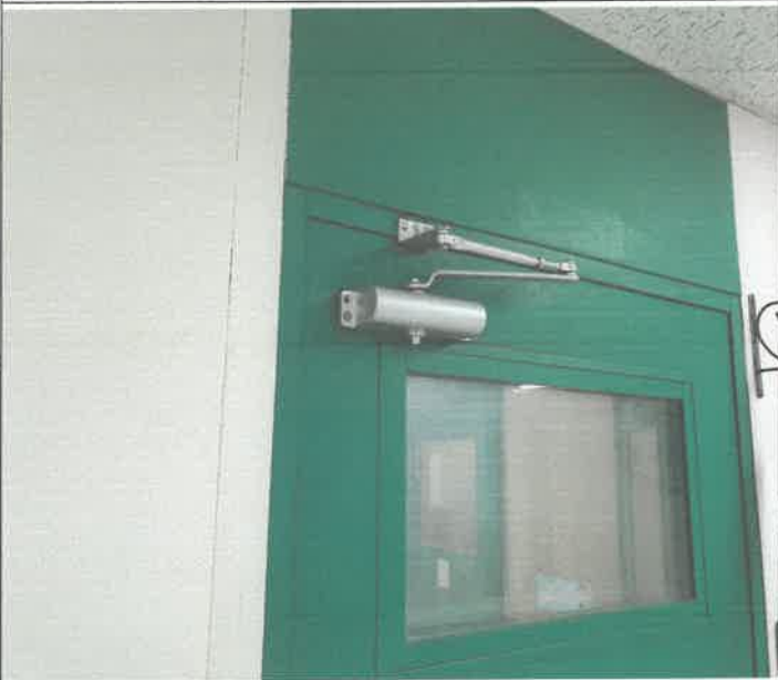
3층 피아노실 출입 문 도어클로저 교체 설치 작업