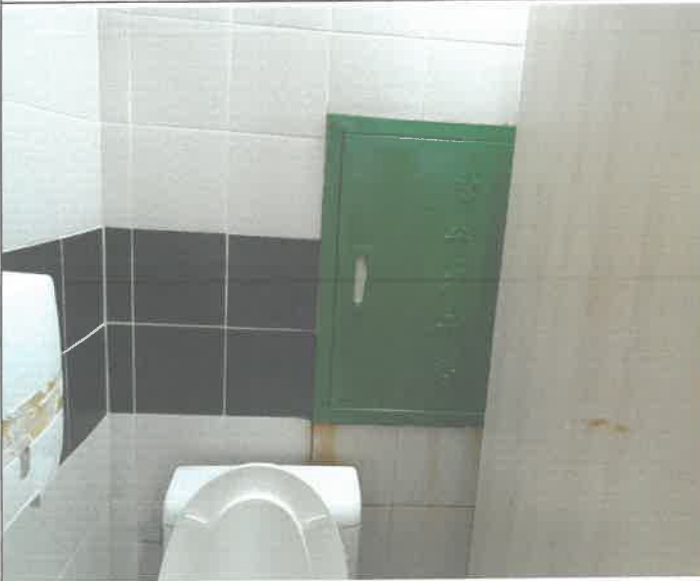
수영장 남. 여. 화장실 벽면 비트 점검구 도색