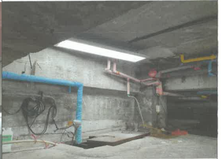
수영장 비트 전등 설치