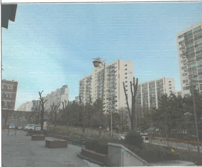
가로등 타이머 조정