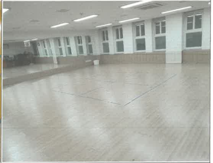
3층 소체육관 나무 바닥 틈 벌어짐 조정 보수