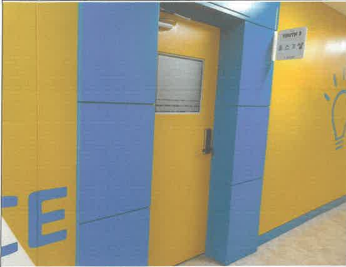
2층 방송실 출입문 닫힘 불량 교정수리