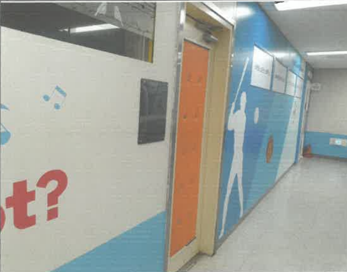
3층 음악 연습실 출입 방음문 하부힌지 이탈 교정 수리