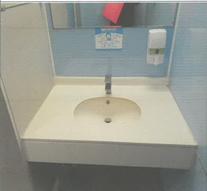
지하 1층 남자 화장실 세면대 막힘 통수 바닥 하수구 막힘 통수