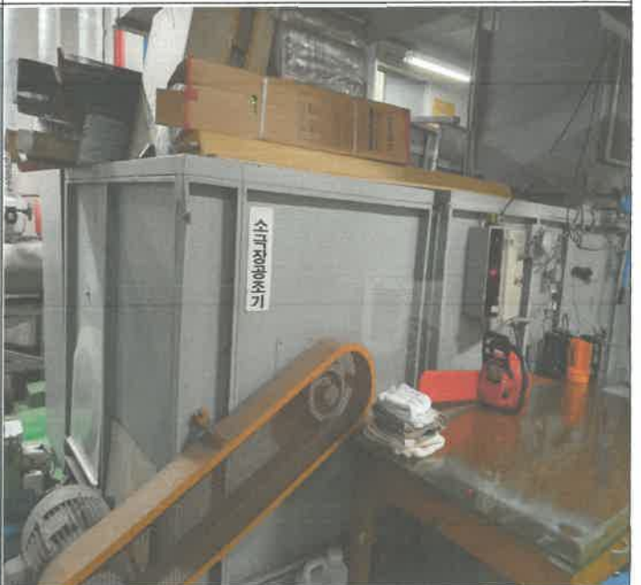
지하 소체육관 급기 덕트 댐퍼 차단