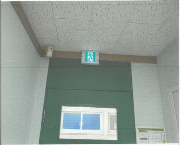
2층 상담 복지센터 2 피난 유도등 배터리 커넥터 불량 교체