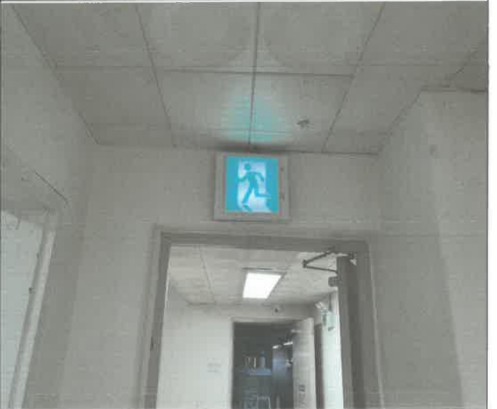
지하 2층 복도 피난유도등 점등 불량 교체