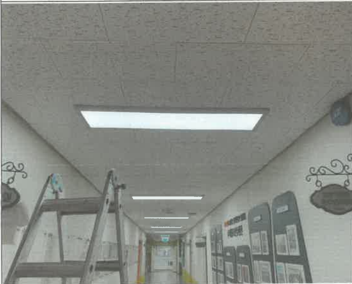
3층 업무지원팀 복도 천장 매립 등 점등 불량 안전기 교체