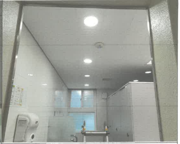
1층 남자 화장실 천장 다운라이트 점등 불량 교체 2개소